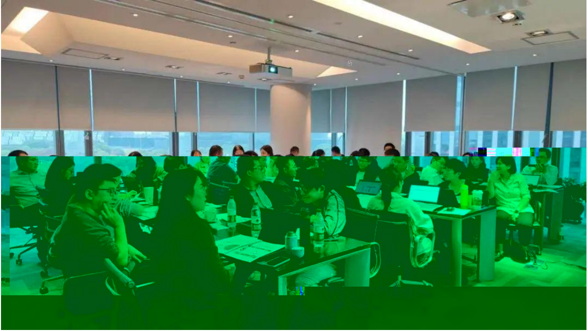
Autodesk, F 500